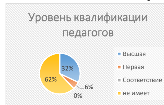
Диаграмма № 2